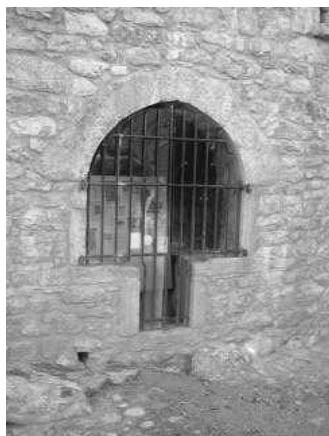
le bureau du festival