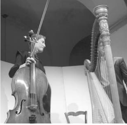
Photos édition 2002 © Jean Férole Anne Gastinel Xavier de Maistre église de Labeaume Trio Wanderer théâtre de verdure